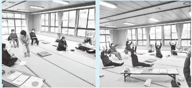
浮金ふれあいサロンの様子

10月には、地域包括支援センター職員が「認知症予防」について講話を行い、自宅でも簡単にできる認知症予防運動や脳トレゲームなど、「認知症」について理解を深めていただく機会となりました。